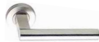
GD10, legirano jeklo