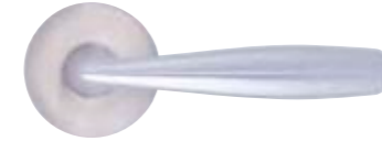
PD21, legirano jeklo