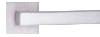
PD12, krom mat