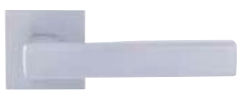
VD20, legirano jeklo