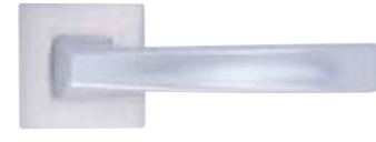
PD15, krom mat