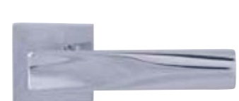
VD22, krom sijaj