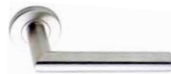
GD15, legirano jeklo